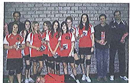
Hetkampioensteam met de trainers

eigenlijk de elektriciteit die de elektromotor aandrijft - gevaarlijk kunnen zijn voor de brandweer als daar niet veilig mee wordt omgegaan. Maar vanzelfsprekend zijn de Toyota hybride auto's voorzien van tal van veiligheidsvoorzieningen. Zo wordt de auto na de klap bij een ongeval of bij het te water raken direct spanningsloos. Verder zijn de spanningsleidingen in een hybride auto altijd fel oranje zodat iedereen ze meteen kan herkennen. En dat herkennen, dat is een belangrijk punt voor de brandweer. Daarom zijn deze studieavonden bij Autobedrijf van Oijen door Brandweer West Maas en Waal als zeer nuttig ervaren. "We hebben nu uitleg gehad van echte specialisten!"