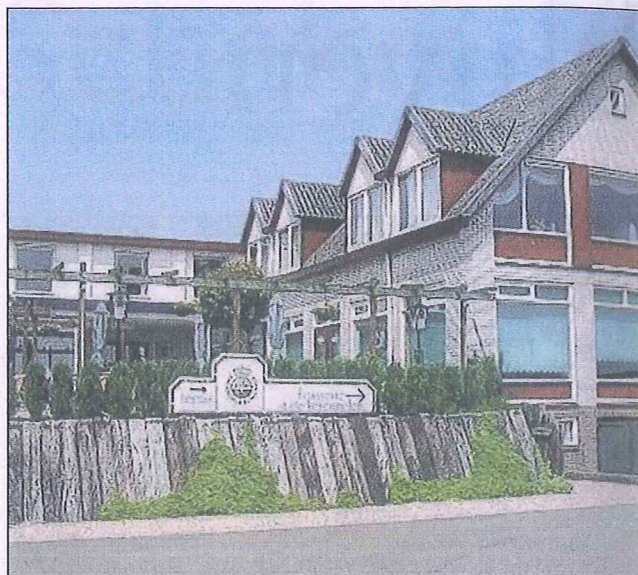
Brasserie 'In de korenmolen' gezien vanaf de zuidkant.

Met aankoop van voormalig molenkorenmolen versterkt Adri van Ooijen zijn bedrijf naast de Gouden Ham in Maasbommel.