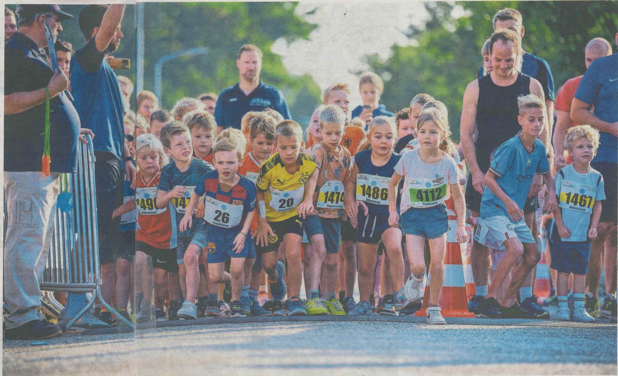
▲ Voor de kinderen van 1 tot en met 6 jaar was er een hardlooptwedstrijd van 650 meter.

over de 21,1 kilometer gedaan en verlaat vol trots met zijn verdiende banaan en een flesje water het parcours.